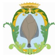
Comune di Comacchio