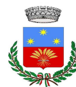
Comune di Ostellato