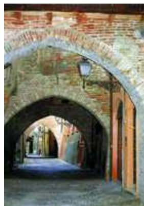
Ferrara "scorcio" di via Volte

SUPPLEMENTO giornaliero noleggio bici € 9,00