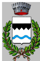
Comune di Ro